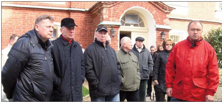
Когда выдавалось свободное время, участники семинара знакомились с достопримечательностями Балаама