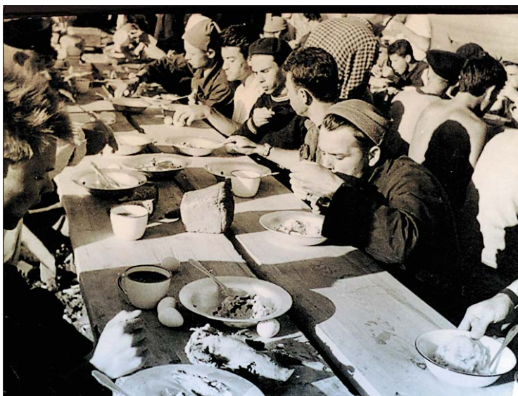
Студотрядовская столовая. Без излишеств, но сытно